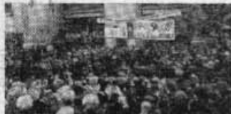
À Boulogne, le samedi, les 33.000 métallurgistes des usines Renault défilent.