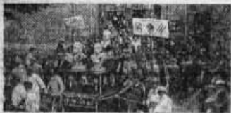
À Vincennes, le samedi, le défilé de grévistes avec les bannières de la Nouvelle-France.