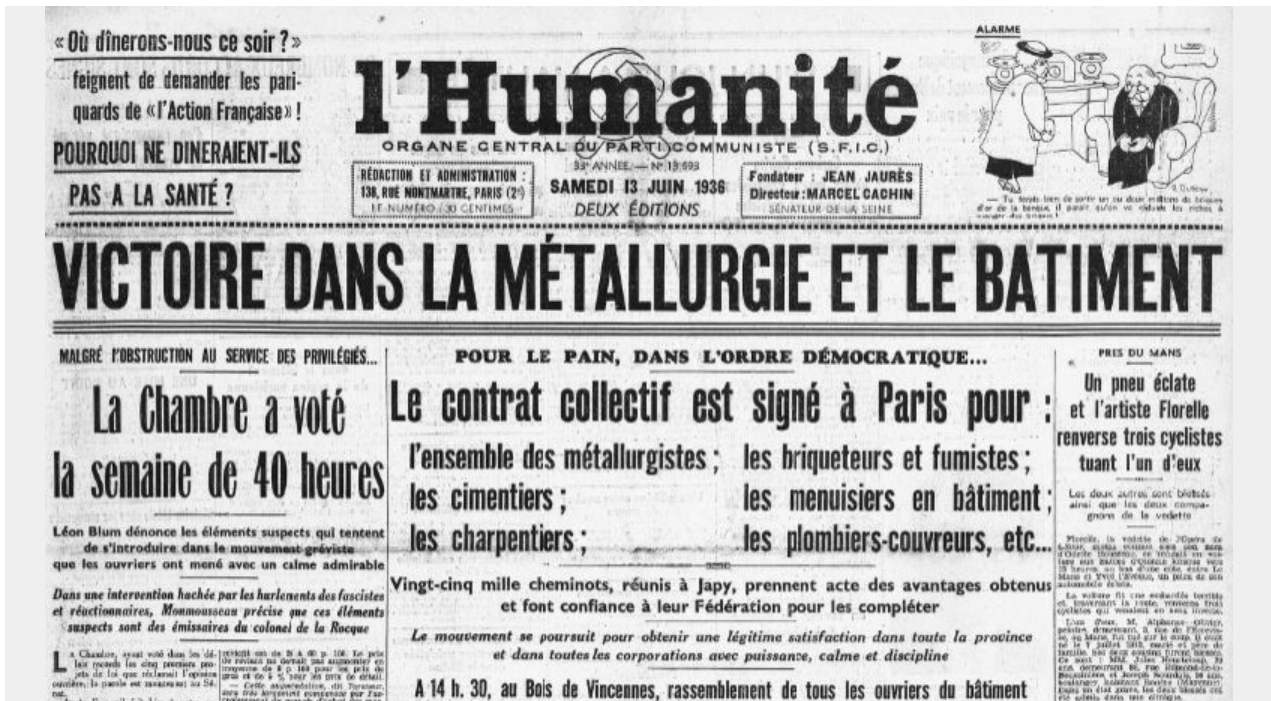
L'humanité le 12 juin 1936 raconte l'adoption de la loi sur les conventions collectives par branche