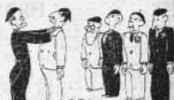
A la suite d'un fait divers de la région de Paris... On a vu à l'œuvre de la 10e section des policiers...