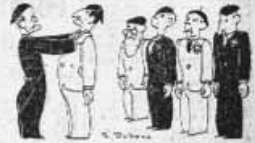
A la suite d'un fait d'armes de répression de nos partisans. C'est à l'ordre de la 10e section des policiers...