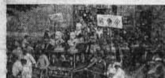
Les grévistes de la région parisienne...