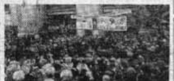
Les grévistes de la région parisienne...