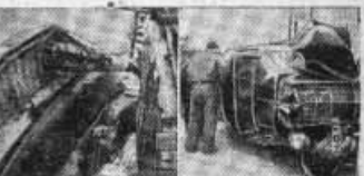
Voilà deux autres actes dans une série de malheurs... Deux accidents...