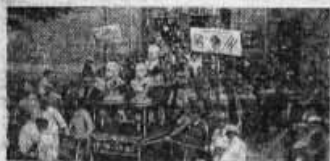
À Vincennes, le dimanche 13 juin, le défilé de grévistes, avec les bannières de la Nouvelle-Éclairage et de la C. G. T.