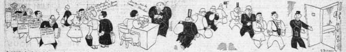
Le journaliste des reporters de l'agence... Les ouvriers du bâtiment... Ceux qui ne font pas grève...