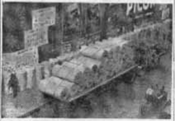
C'est le nombre d'ouvriers de l'usine Renault de Boulogne-Billancourt qui ont participé à la manifestation du dimanche 13 juin...