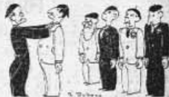
A la suite d'un fait divers de la région de Paris...