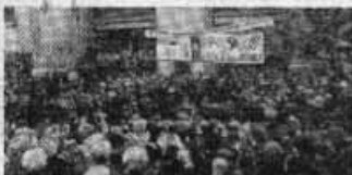
À Boulogne, le dimanche 13 juin, les 33.000 métallurgistes des usines Renault défilent en masse.