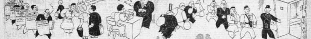
Les grévistes de la région parisienne...