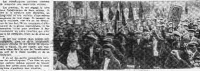
À PARIS, LES OUVRIERS MANIFESTENT SUR LA PLACE

A 14 h. 30, au Bois de Vincennes, rassemblement de tous les ouvriers du bâtiment