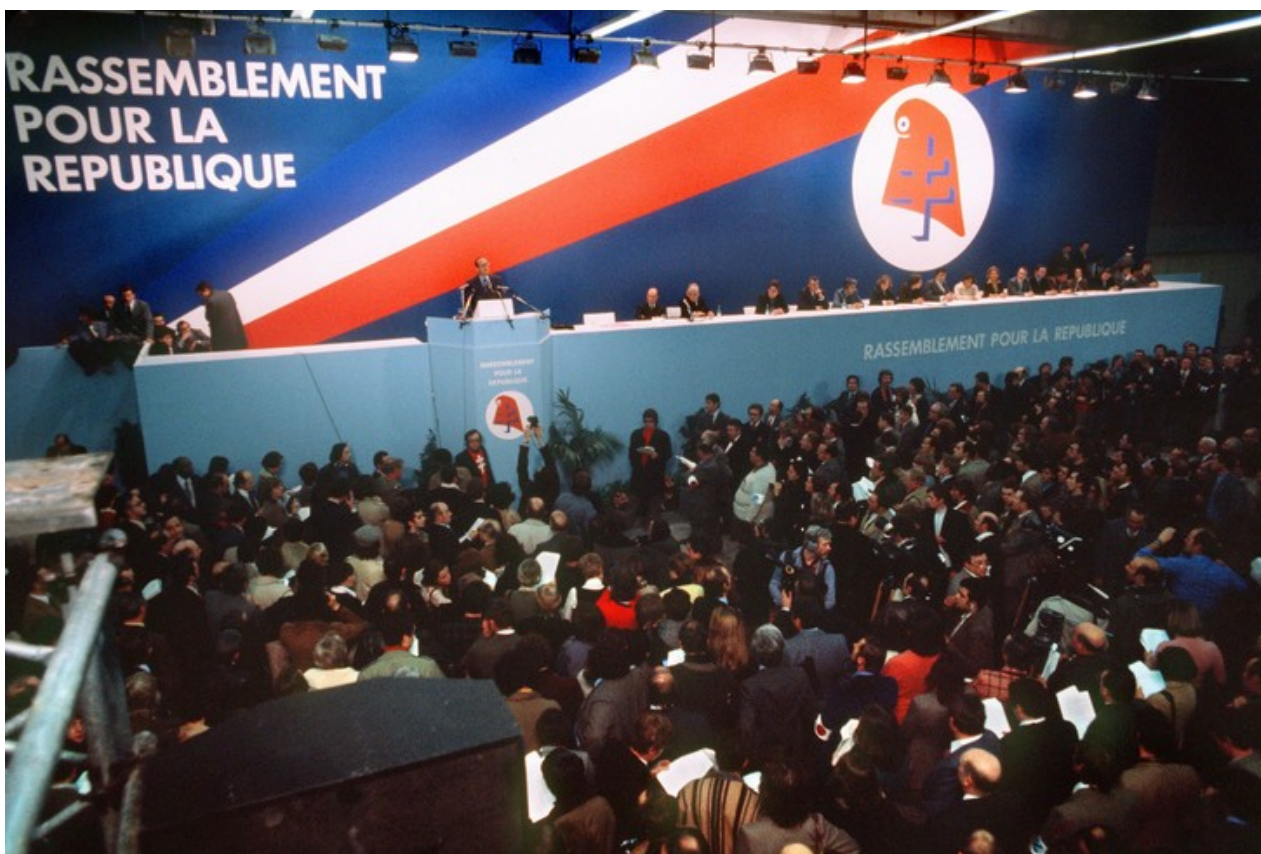
Le lancement du RPR par Jacques Chirac, ancien premier ministre du président Valéry Giscard d'Estaing, le 05 décembre 1976 à Paris. / Afp [6]

Pour faire pièce à cette menace et être en mesure de présenter des candidats lors des législatives de 1978, Valéry Giscard d'Estaing pousse les partis de cadres ou de notables qui le soutiennent à se doter d'une structure confédérale : l'UDF (Union pour la démocratie française). Mais ses composantes refuseront toujours de fusionner et auront beaucoup de mal à surmonter leurs divisions internes après la défaite de 1981. L'échec la candidature de Raymond Barre en 1988 devra beaucoup à la faiblesse et aux divisions de cette structure partisane tournée essentiellement vers la vie parlementaire et la conquête des mandats locaux[7].