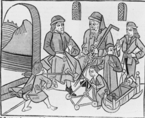
Les étapes de la vie de Bartholomeus Anglicus

Les différents auteurs qui se sont penchés sur l'actualité de nos nouveaux âges de la vie reconduisent généralement la répartition classique des « trois âges de la vie » : enfance, âge adulte, vieillesse[4]. Il arrive parfois que la mort soit considérée comme « le quatrième âge » : ce fut le cas à l'époque médiévale en Europe, c'est encore le cas de certaines cultures de l'ancestralité, comme celle des Amérindiens. Cependant, toute une tradition depuis Saint-Augustin au 5 ème siècle jusqu'à Montaigne à la fin du 16 ème comptait non pas trois, quatre ni même cinq âges de la vie, mais bien sept ! J'ai commenté, dans ma psychologie de l'anniversaire, l'importance du chiffre sept, en matière d'âges de la vie comme d'autres décomptes (jours de la semaine, notes de musique, etc.)[5]. Or nous voici sans doute revenus à ces sept âges de la vie. En effet, à chaque fois que la vie s'allonge, ce n'est pas de la vieillesse qui s'ajoute à la vieillesse, mais de nouveaux âges qui apparaissent. Ainsi, lorsque l'on se mit à parler de « troisième âge » avec la généralisation de la retraite au milieu du 20 ème siècle, on signifiait qu'après l'enfance (premier âge) et la vie adulte (deuxième âge), un « troisième » âge apparaissait. C'était cependant oublier qu'un nouvel âge était également apparu entre l'enfance et la vie adulte : l'adolescence ! Ainsi, ce fameux troisième âge constituait en réalité déjà un quatrième âge.