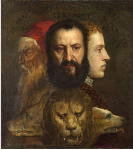
Allégorie du temps gouverné de Titien