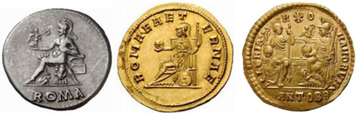
Fig 3 - Le droit de la lance et la communication de la mégapole

alors qui sont les assassins ? Et faut-il récuser la thèse, avancée par d'autres historiens, du « suicide » par démesure et arrogance quand la voix des peuples restait inaudible ? Si la « chute » tant de fois annoncée par les polémistes chrétiens ou les oracles n'a pu être évitée, le miracle romain a pourtant eu lieu. Tel le phénix, triomphant des chrétiens et des barbares, grosse d'une culture largement partagée, Rome se perpétue dans la Ville éternelle et ressuscite à l'envi ( fig.3 ) essaimant en deuxième et troisième Rome que se sont proclamées Constantinople et Moscou.