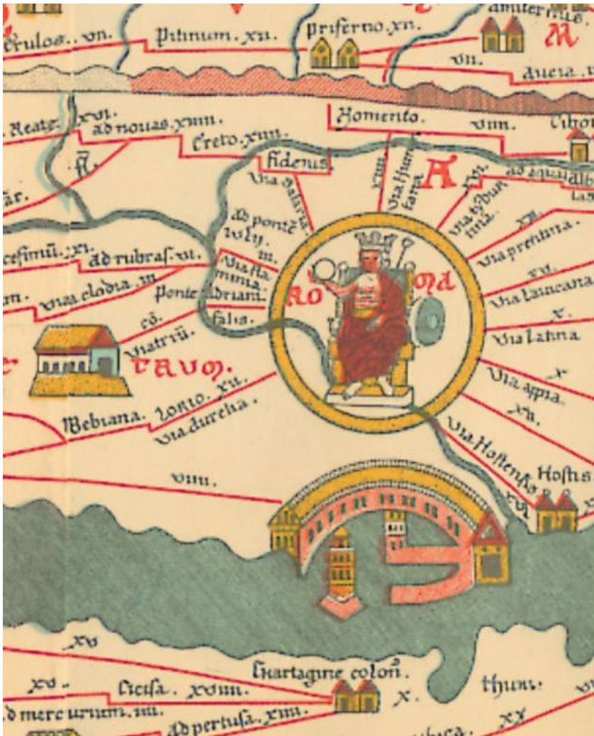
Fig. 1 - Tous les chemins partent de Rome

les quelque 100000 km de voies qui, depuis le milliaire d'or, partent de Rome pour relier les terres lointaines ( fig. 1 ).